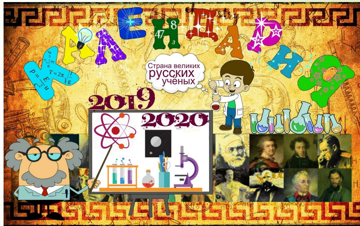
Календария - страна великих русских учёных